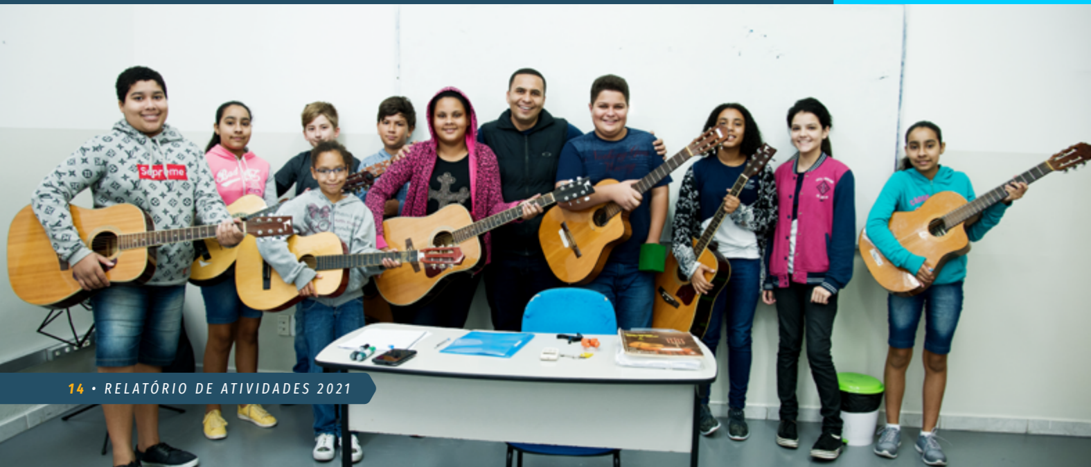
Foto de atividade realizada antes da pandemia da Covid 19

O principal objetivo da colônia de férias foi promover atividades lúdicas e recreativas que contribuíssem com o desenvolvimento, socialização e diversão das crianças e adolescentes. Essa atividade reuniu equipes e participantes das unidades: CAC, Cia. de Artes e Esportes e Progen.