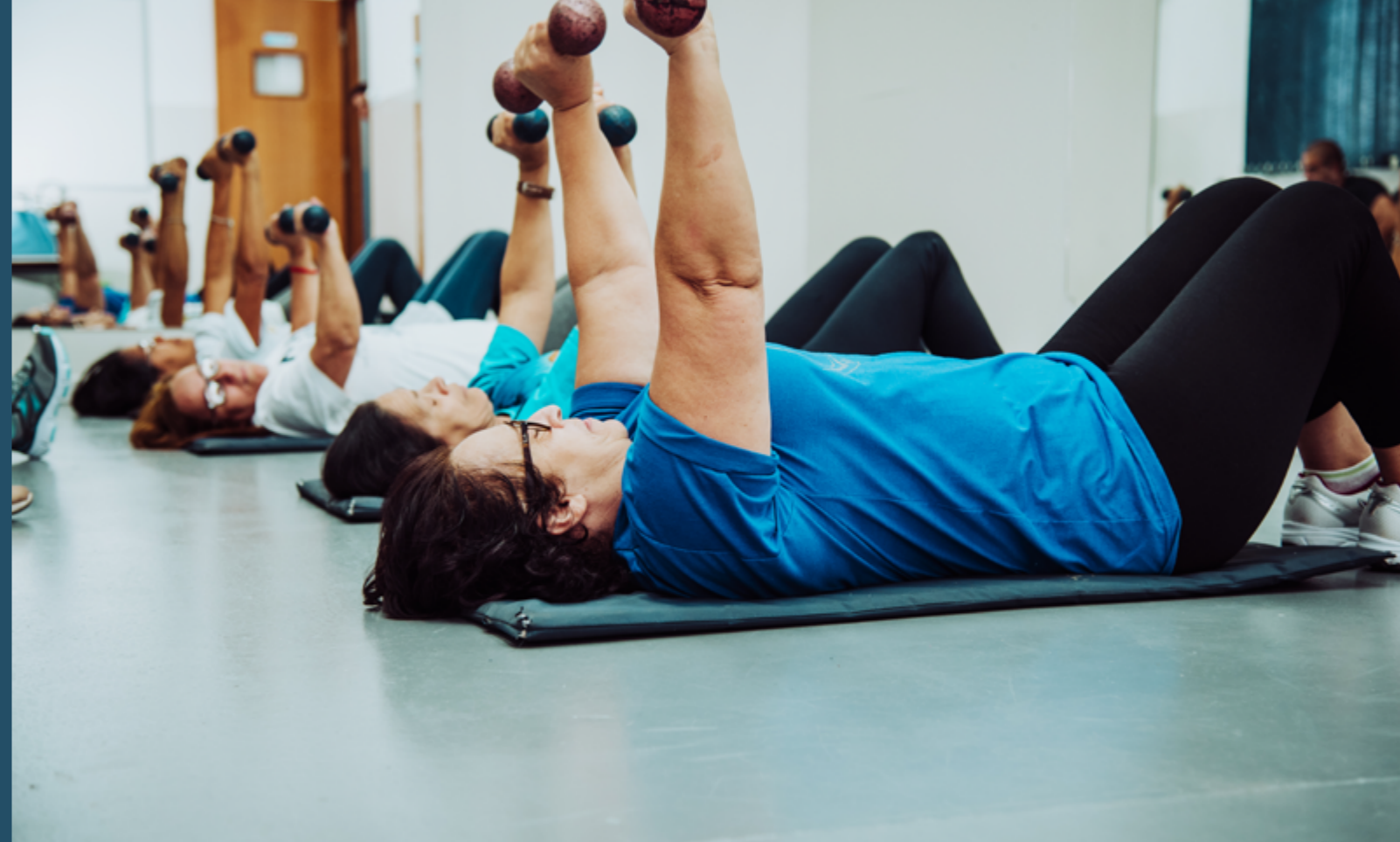
Foto de atividade realizada antes da pandemia da Covid 19