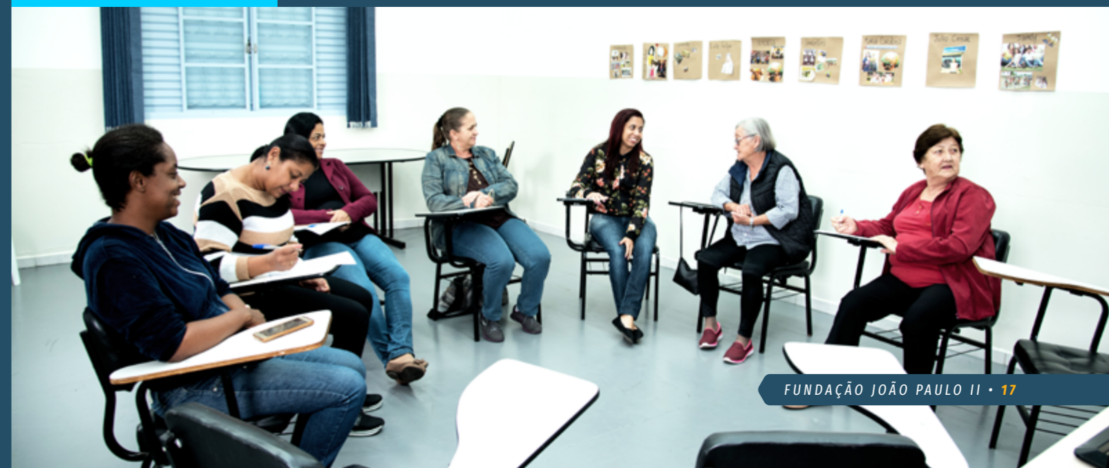
Foto de atividade realizada antes da pandemia da Covid 19

Objetivo: O grupo socioeducativo com os adolescentes integrantes do Programa EVT (Escola de Vida e Trabalho), baseia-se na necessidade de trabalhar questões referentes à adolescência e ao processo de desenvolvimento humano, abordando temas diversos que possibilitem o maior crescimento pessoal, profissional e social.