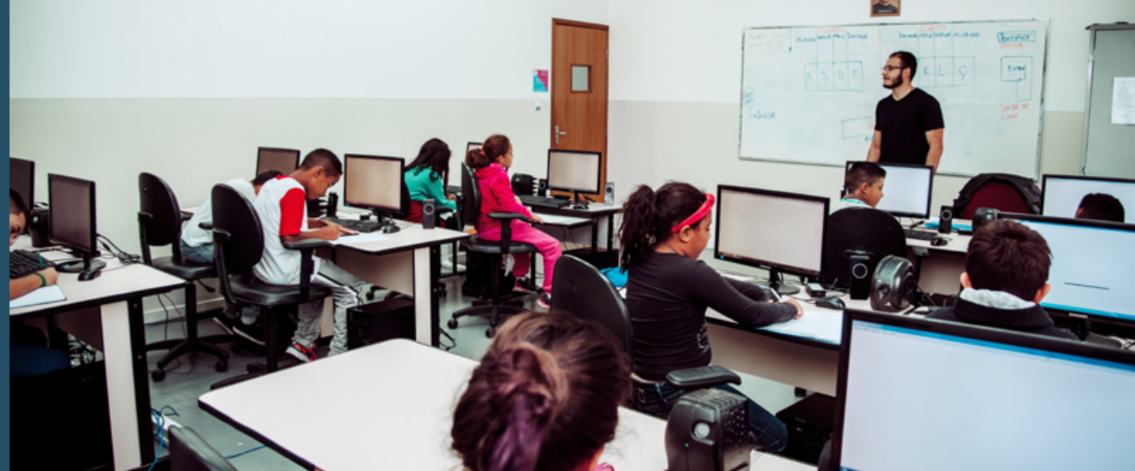
Foto de atividade realizada antes da pandemia da Covid 19