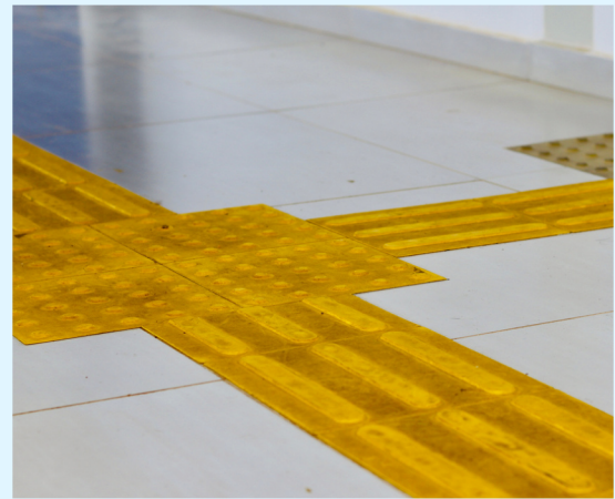
Piso Tátil FCN