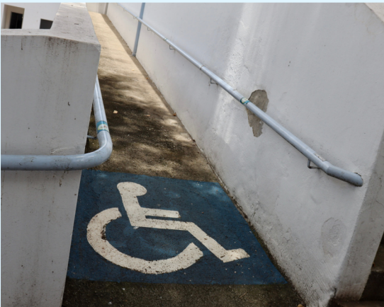
Rampa de acesso FCN

A pessoa com deficiência deve ser tratada com respeito, pois assim como qualquer outra pessoa traz uma bagagem cultural, familiar e uma história de vida. Por isso entende-se que todas as pessoas com deficiência têm o direito à cidadania e à inclusão social. Segundo o Estatuto de Pessoa com Deficiência a avaliação de deficiência é analisada por uma equipe multiprofissional, considerando as variantes: biológicas, psicológicas e sociais do indivíduo.