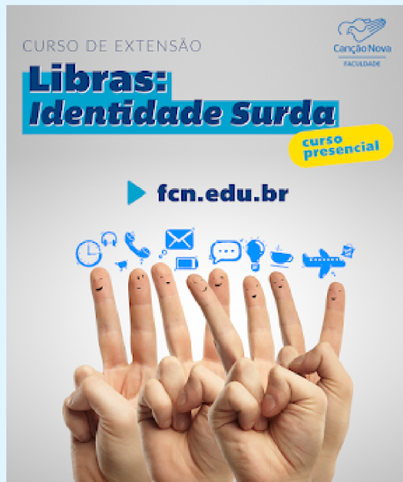
Peça de divulgação de Curso de Libras FCN