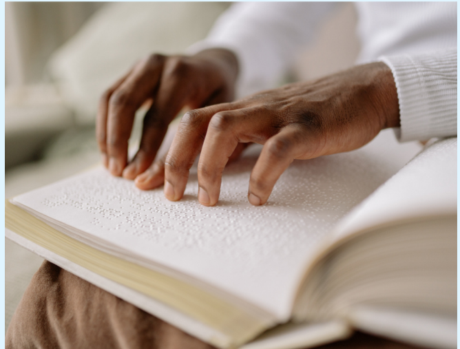
Máquina de escrever em Braille FCN