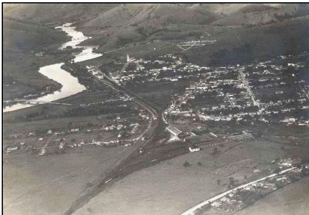
Cachoeira Paulista: Vista geral do núcleo urbano, observa-se orla ferroviária e ponte sobre o rio Paraíba do Sul. 9

Dados fornecidos pelo SEADE 10 referentes ao Ensino Médio na região, para o ano de 2021, assinalam que há total de 1.211 matrículas no município de Cachoeira Paulista, considerando as redes pública e privada. Nos municípios limítrofes a Cachoeira Paulista, portanto inseridos em área de influência da Faculdade Canção Nova (Canas, Cruzeiro, Lorena, Piquete e Silveiras), o número total de matrículas no Ensino Médio, também relativo ao ano de 2021, chegou a 8.331 matrículas.