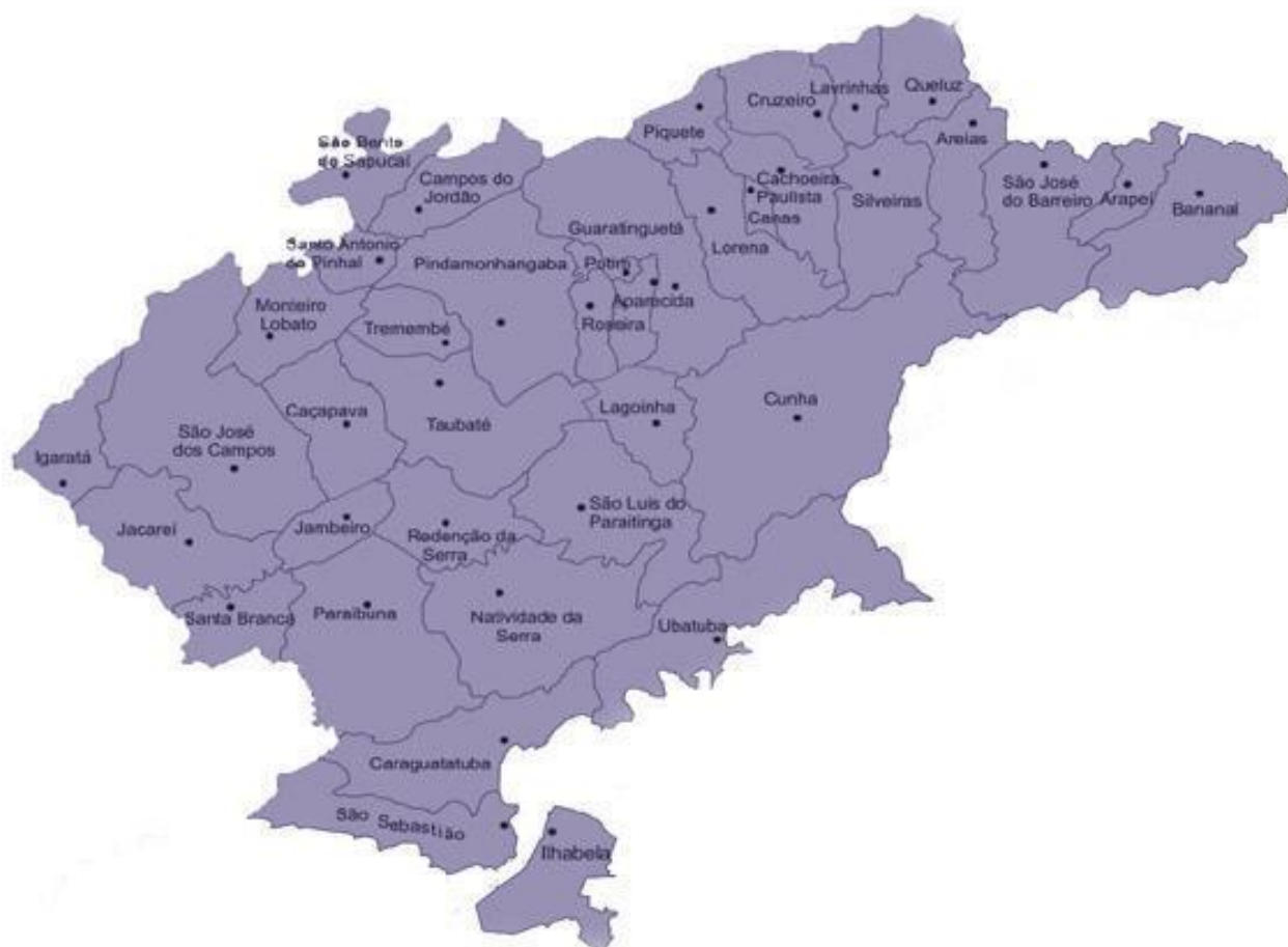
Figura: Mapa da divisão municipal da Região Metropolitana do Vale do Paraíba e Litoral Norte. Base Cartográfica: EMTU 7 , 2023.

A Região Metropolitana do Vale do Paraíba e Litoral Norte apresenta total de 86.565 matrículas 4 no Ensino Médio, considerando dados referentes a 2020. Analisando dados referentes ao município de Cachoeira Paulista, onde se encontra a Faculdade Canção Nova, e referentes aos municípios limítrofes (Canas, Cruzeiro, Lorena, Piquete e Silveiras) há 8.331 matrículas 5 no Ensino Médio (2021) e uma população total residente de mais de 210 mil habitantes 6 (2022).