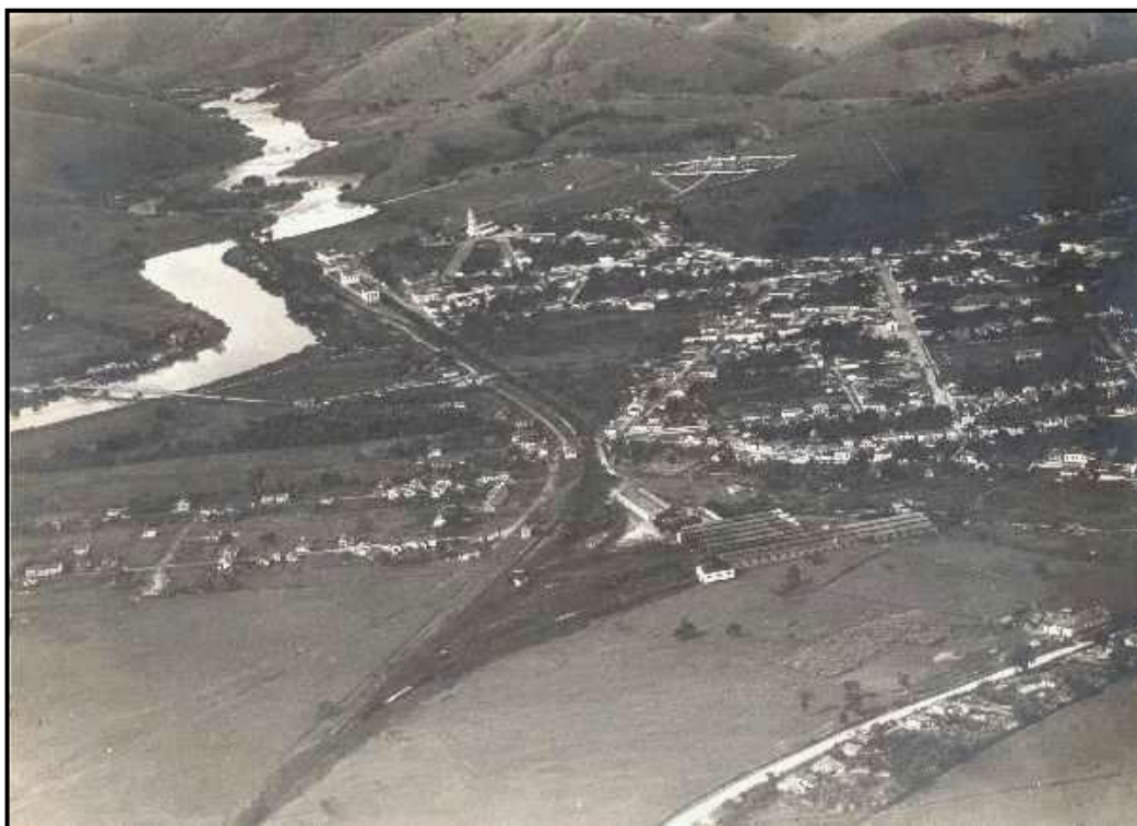
Cachoeira Paulista: Vista geral do núcleo urbano, observa-se orla ferroviária e ponte sobre o rio Paraíba do Sul. 9

Dados fornecidos pelo SEADE 10 referentes ao Ensino Médio na região, para o ano de 2021, assinalam que há total de 1.211 matrículas no município de Cachoeira Paulista, considerando as redes pública e privada. Nos municípios limítrofes a Cachoeira Paulista, portanto inseridos em área de influência da Faculdade Canção Nova (Canas, Cruzeiro, Lorena, Piquete e Silveiras), o número total de matrículas no Ensino Médio, também relativo ao ano de 2021, chegou a 8.331 matrículas.