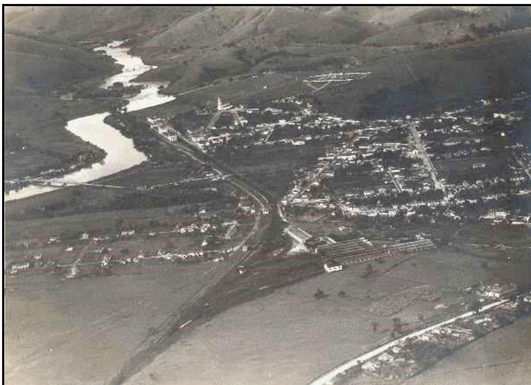
Cachoeira Paulista: Vista geral do núcleo urbano, observa-se orla ferroviária e ponte sobre o rio Paraíba do Sul. 9

Dados fornecidos pelo SEADE 10 referentes ao Ensino Médio na região, para o ano de 2021, assinalam que há total de 1.211 matrículas no município de Cachoeira Paulista, considerando as redes pública e privada. Nos municípios limítrofes a Cachoeira Paulista, portanto inseridos em área de influência da Faculdade Canção Nova (Canas, Cruzeiro, Lorena, Piquete e Silveiras), o número total de matrículas no Ensino Médio, também relativo ao ano de 2021, chegou a 8.331 matrículas.