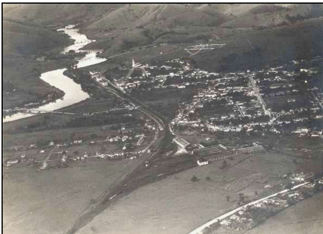
Cachoeira Paulista: Vista geral do núcleo urbano, observa-se orla ferroviária e ponte sobre o rio Paraíba do Sul. 9

Dados fornecidos pelo SEADE 10 referentes ao Ensino Médio na região, para o ano de 2020, assinalam que há total de 1.183 matrículas no município de Cachoeira Paulista, considerando as redes pública e privada. Nos municípios limítrofes a Cachoeira Paulista, portanto inseridos em área de influência da Faculdade Canção Nova (Canas, Cruzeiro, Lorena, Piquete e Silveiras), o número total de matrículas no Ensino Médio, também relativo ao ano de 2020, chegou a 7.592 matrículas.